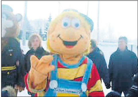
Les mascottes sont omniprésentes lors des journées pour enfants.

A près une petite accalmie d'une journée en début de semaine, la programmation des activités de la dixième édition du Festival des glaces reprend de plus belle mardi avec la journée du Club de l'âge d'or. La population est invitée à participer à un tournoi de palet américain présenté