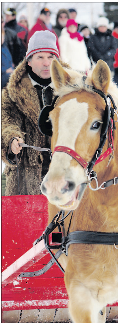
Le Derby des chevaux est de retour pour une deuxième année au Festival des glaces de Saint-Gédéon.

Le Derby des chevaux qui a connu l'an dernier beaucoup de succès est de retour pour une deuxième année. Cette activité avait offert de belles sensations aux visiteurs. Le tout se termine avec un souper hot-dogs sous le chapiteau