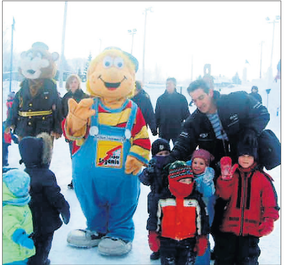
La course des minounes agrémentée la dernière journée dominicale du Festival des glaces de Saint-Gédéon.

« Cette dixième édition du Festival des glaces doit se conclure avec un feu d'artifice. Le comité organisateur invite la population à