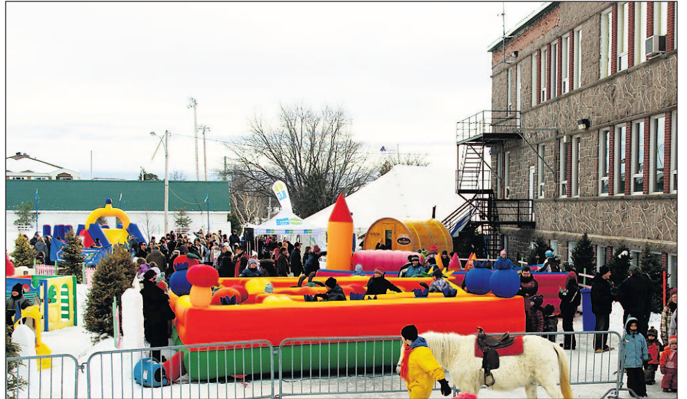
Les journées pour les jeunes des écoles primaires et des centres de la petite enfance sont toujours très achalandées au Festival des glaces de Saint-Gédéon.

Vendredi, le Festival des glaces offre au public un autre spectacle gratuit avec le groupe Top Dance : « Ce groupe de la région est très bien connu. Le groupe se compose de onze musiciens qui, vous feront vivre une soirée inoubliable en interprétant les succès populaires », assure Lise Bouchard.