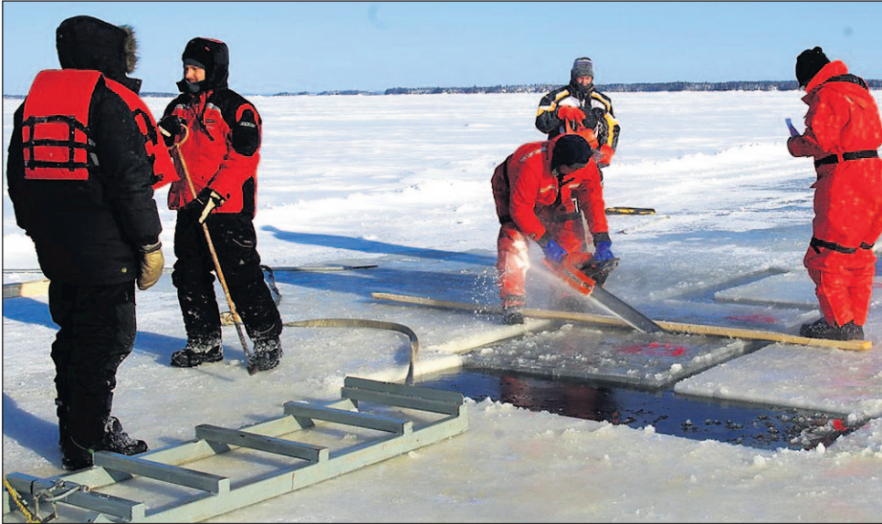
L'extraction des blocs de glace est une opération cruciale et les gens sont invités à assister à l'opération sur le lac Saint-Jean, le samedi 5 février prochain

« Ceux-ci doivent cependant nous déposer des esquisses de leur projet au plus tard le vendredi 4 février, mais on peut d'ores et déjà être assuré d'une belle qualité d'artistes. Rappelons qu'un montant de 150 $ est remis par bloc de glace. Grâce à l'aide financière accordée par Patrimoine canadien, le comité organisateur peut développer l'art de la sculpture sur glace, un médium peu connu et peu pratiqué par les artistes », de conclure Lise Bouchard, responsable du Service des loisirs à la municipalité de Saint-Gédéon et coordonnatrice du Festival des glaces.